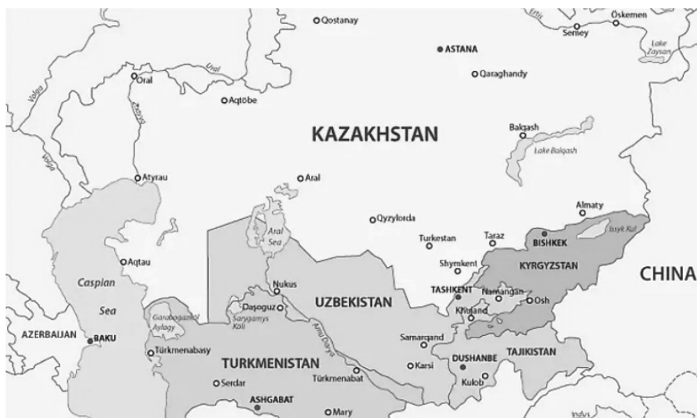
Figure 1. Central Asian Countries Rysunek 1. Kraje Azji Środkowej