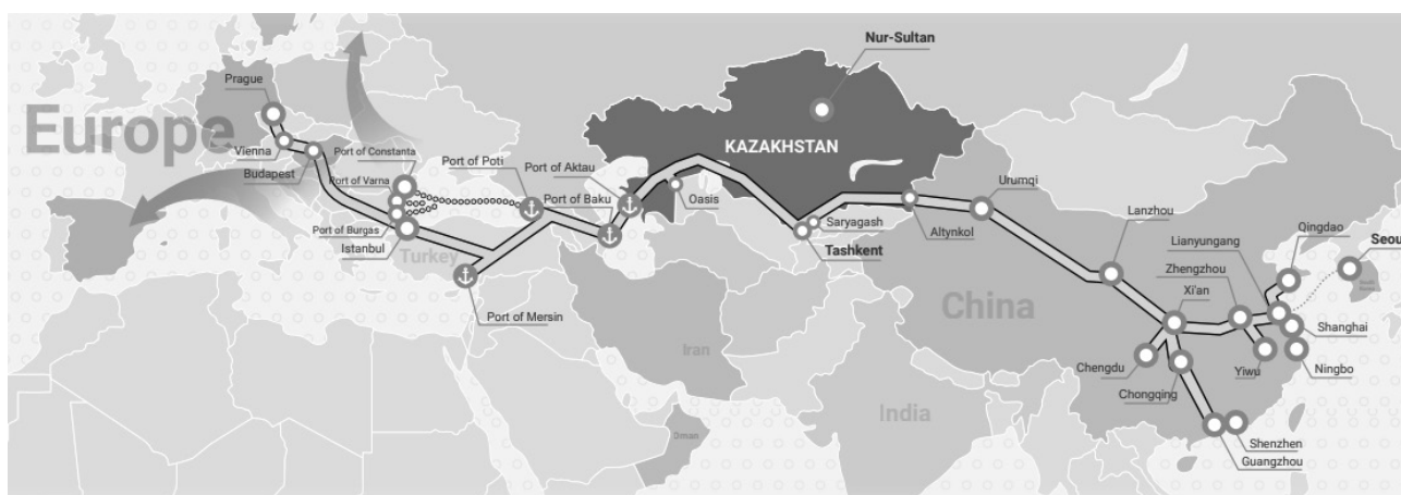
Figure 2. The "Middle Corridor" Rysunek 2. „Korytarz Środkowy”

Do wybuchu wojny na Ukrainie zdecydowana większość kolejowego ruchu towarowego między Chinami a Europą - 95% - odbywała się północnym korytarzem transportowym, czyli przez Kazachstan, Rosję i Białoruś. Jednak ze względu na sankcje gospodarcze i finansowe nałożone na Rosję przez kraje zachodnie, branża transportowa i logistyczna w Rosji znajduje się w trudnej sytuacji. W rezultacie międzynarodowi przewoźnicy szukają alternatywnych tras ominięcia Rosji, a jedną z takich tras, które przyciągają uwagę, jest „Nowy” Jedwabny Szlak, Korytarz Środkowy, znany również jako Transkaspijski Międzynarodowy Szlak Transportowy (TITR), użytkowany od 2017 roku (Bernek, 2022).