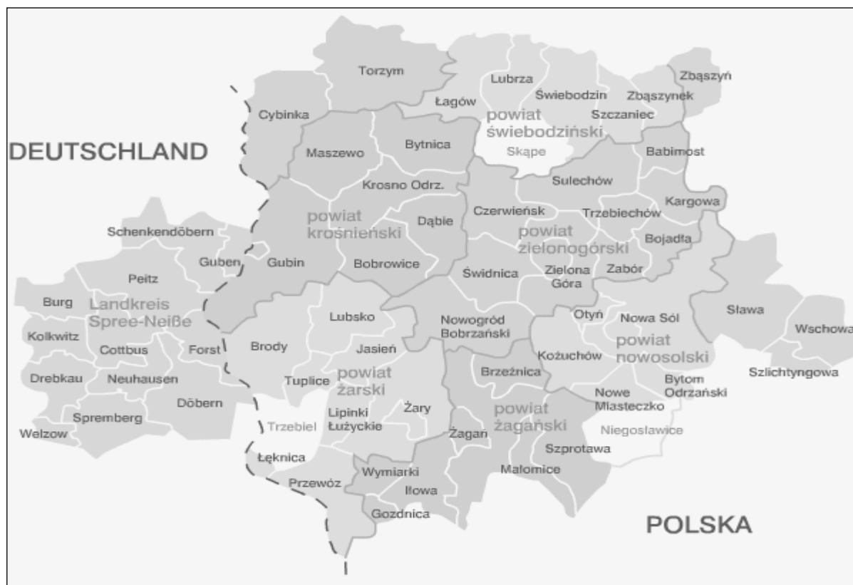
Figure 1. The Spree-Nysa-Bohr Euroregion

to do polskiej części Euroregionu należą dwie gminy z powiatu Słubickiego i Sulęcińskiego tj. Cybinka i Torzym oraz gmina Zbąszyń, która należy do województwa wielkopolskiego. Po stronie niemieckiej Euroregion obejmuje powiat Spree-Nysa oraz miasto grodzkie Cottbus (Rysunek 1.).