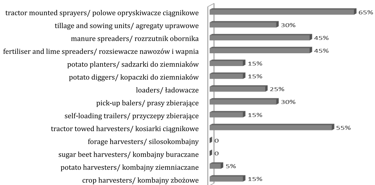
Figure 2. The level of machinery equipment used by ecological farms in plant production Wykres 2. Stopień wyposażenia gospodarstw ekologicznych w maszyny do produkcji roślinnej

Badania zrealizowane na grupie 70 gospodarstw rolnych powiatu biłgorajskiego przez Z. Wasąga wskazały, iż poziom wyposażenia gospodarstw w środki mechanizacji charakteryzował się tendencją wzrostową. Szczególnie uwidoczniono się to w okresie przed i po dofinansowaniu z funduszy UE. Z. Wasąga wskazuje również na problem nieracjonalnego wykorzystania maszyn i urządzeń rolniczych (Wasąga 2011). Dlatego też poza samym faktem posiadania maszyn i urządzeń ważnym aspektem jest stopień ich wykorzystania w realizowanej produkcji rolniczej. W opinii kierowników gospodarstw znaczna część maszyn i urządzeń była wykorzystywana zaledwie do 25% możliwości (np.: sadzarki do ziemniaków, rozrzutniki obornika).