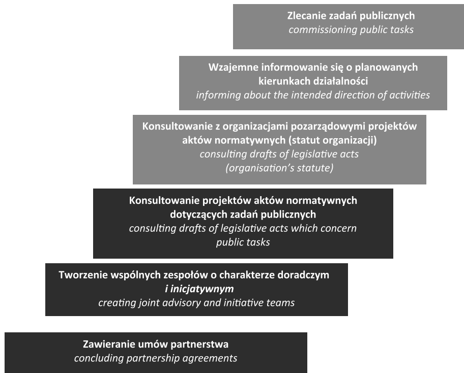
Figure 1. The forms of cooperation between local authorities and NGOs

Ustawa nakłada na samorzady lokalne obowiązek uchwalania rocznych programów współpracy z organizacjami pozarządowymi będących podstawą określającą zakres, ramy i formy współpracy samorządu oraz organizacji pozarządowych, a także środki publiczne przeznaczone na tę współpracę. Najczęściej wykorzystywane formy współpracy prezentuje rysunek. 1.