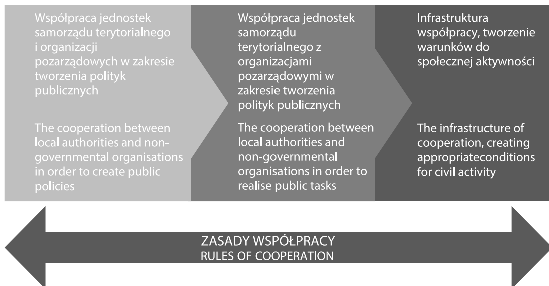
Figure 2. A model of the three areas of cooperation between local authorities and non-governmental organizations Rysunek. 2 Trzy płaszczyzny współpracy JST i organizacji pozarządowych – ujęcie modelowe

Sam, natomiast wypełnianie go treścią powinno być zależne od regionalnego lub lokalnego kontekstu. Model jest więc w zamierzeniu zbiorem określonych narzędzi, które zgodnie z potrzebami i możliwościami mogą być wykorzystane przez każdy polski samorząd. Oznacza to, że pozostaje on uniwersalny, a każdy samorząd może wykorzystać odpowiednie narzędzia zawarte w modelu zgodnie ze swoimi potrzebami i możliwościami. Trzeba jednak podkreślić, że w modelu nacisk kładziony jest przede wszystkim na kulturę współpracy, rozumianą jako zjawisko daleko wykraczające poza zapisy prawa. Część zawartych w nim zadań, np. partnerstwa lokalne, nie wynika bowiem z regulacji prawnych, lecz właśnie z kultury współpracy. Ponadto w samych przepisach prawa część rozwiązań jest obligatoryjnych (np. roczne programy współpracy), a część fakultatywnych (np. rady działalności pożytku publicznego czy wieloletnie programy współpracy). O zastosowaniu konkretnych rozwiązań (poza obowiązkowymi) powinni zdecydować partnerzy, kierując się kryterium ich przydatności. W modelu zaleca się oparcie współpracy na trzech płaszczyznach (Rysunek 2).